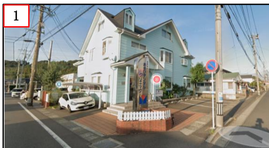
あさひデンタルクリニック