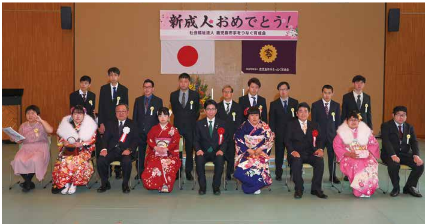
令和3年 鹿児島市手をつなぐ育成会 成人式 (ふれあい館)